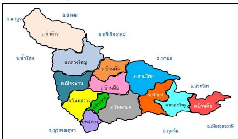
รูปภาพที่ 1 แผนที่อำเภอบ้านฝือ

ประชากร ณ วันที่ 31 ธันวาคม 2565 จำนวน 109,475 คน เป็นชาย 54,591คน เป็นหญิง 54,884 คน มี 36,023 หลังคาเรือน เฉลี่ย 1 หลังคาเรือน มีคนอาศัย 3 คน ความหนาแน่นของประชากร 109.91 คน/ตารางกิโลเมตร